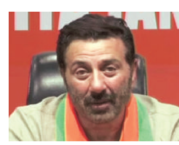
The property belonging to Sunny Deol known as Sunny Villa, occupies an area of 599.44 square metres on Gandhigram Road in Juhu

Elaborating on the technical reasons for withdrawing the notice, a Bank of Baroda spokesperson said that the total dues did not specify the exact quantum to be recovered. And